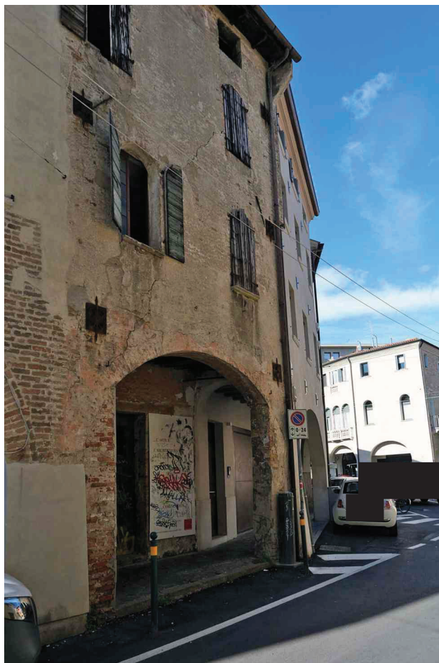
N. 2 – Vista da Via Riccati (2 di 2).