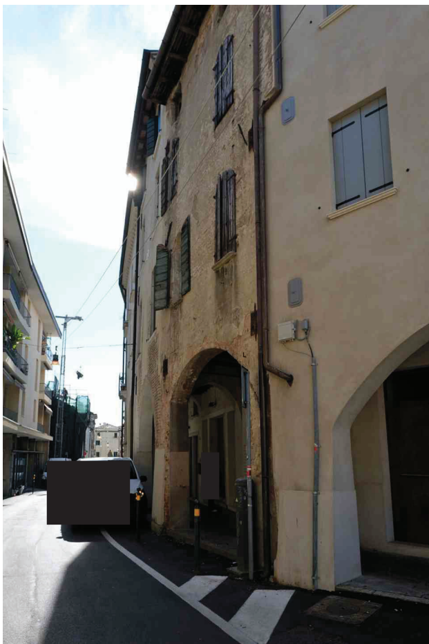
N. 1 – Vista da Via Riccati (1 di 2).

LOTTO UNICO – Palazzetto storico entro mura non abitabile Treviso (TV), Via Riccati n. 10