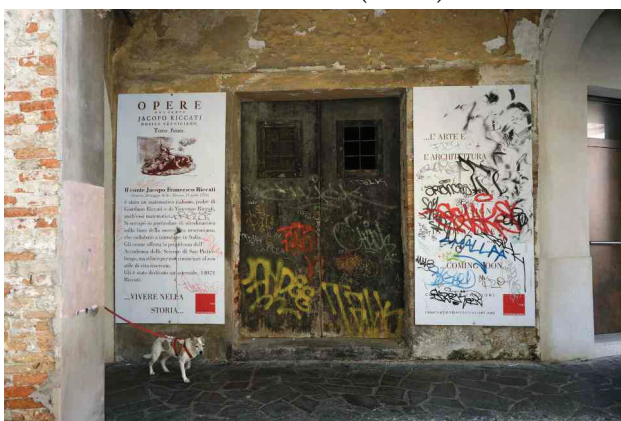
N. 3 – ingresso piano terra.